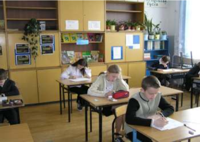
Dzieci ze szkoły podstawowej w Galewie w trakcie pisania konkursu