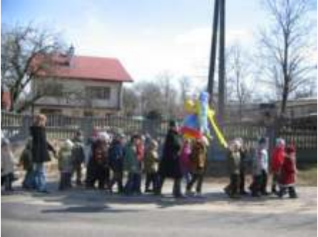
Przedszkolaki z wychowawcami

Tradycj w Gminnym Przedszkolu w Brudzewie jest coroczna uroczysto powitania nadchodz cej wiosny. Nauczycielki z dzie mi przygotowały ze słomy i bibuły „Marzann ” symbol odchodz cej zimy. Barwny korowód ruszył ulicami Brudzewa nad rzek Kielbask . Tam wierszem i piosenk dzieci po egnali zim . Nast pnie z nadziej szybkiego nadej cia prawdziwej wiosny oraz pierwszymi gał zkami kwitn cej wierzby powrócili my do przedszkola.