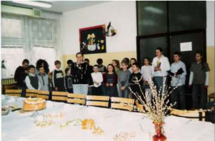
Wyst py artystyczne dzieci z .O.W.