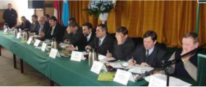
Zdjęcie z spotkania rolników z parlamentarzystami.