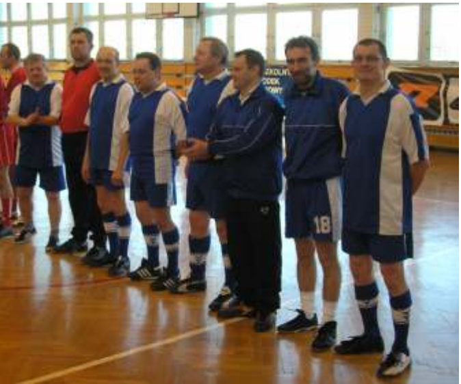
Zdjęcie z Turnieju Samorządowców w Halowej Piłce Nożnej