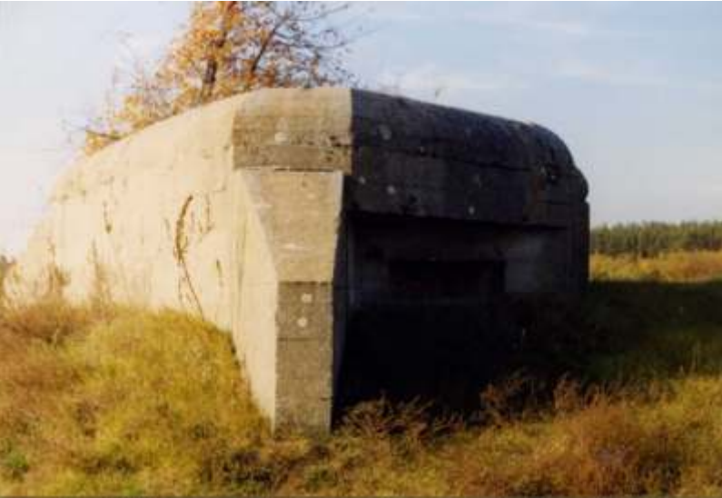
Jeden z bunkrów „Przedmoście Koło”

Budowa schronów „Przedmoście Koło” jak i innych umocnień polskich rozpoczęła się w ostatnich dniach miesiąca czerwca oraz w lipcu 1939 roku, gdy