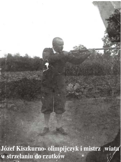
Józef Kiszurno- olimpijczyk i mistrz świata w strzelaniu do rzutków