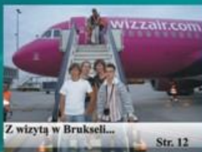
Z wizytą w Brukseli...