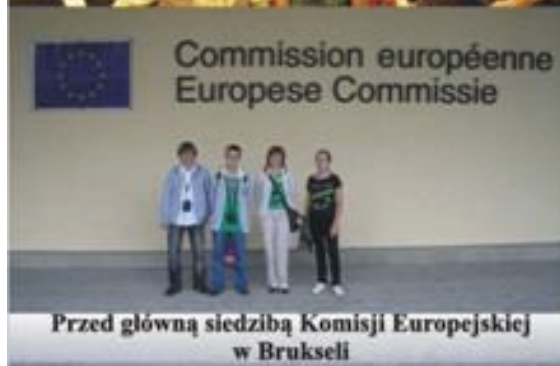
Commission européenne Europese Commissie