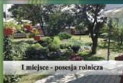
I miejsce - posesja rolnicza