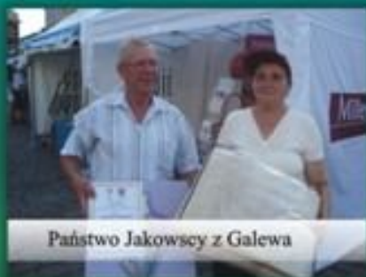
Państwo Jakowscy z Galewa