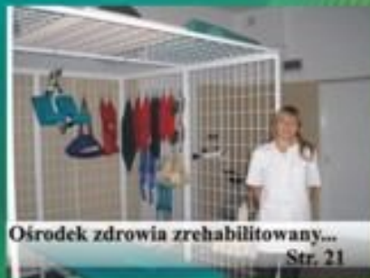
Ośrodek zdrowia zrehabilitowany...