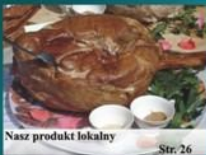
Nasz produkt lokalny

Bogdałów, Bratuszyn, Brudzew, Brutzyń, Cichów, Chrząblice, Dąbrowa, Galew, Głowy, Izabelin, Janiszew, Janów, Końca, Kozubów, Kozmin, Krwony, Kuźnica Janiszewska, Kwiatków, Marulew, Olimpia, Podłużycze, Tarnowa, Wincentów.