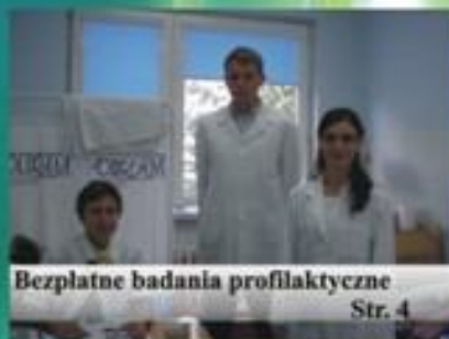
Bezpłatne badania profilaktyczne