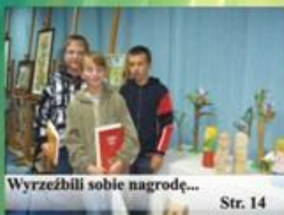
Wyrzeźbili sobie nagrodę...