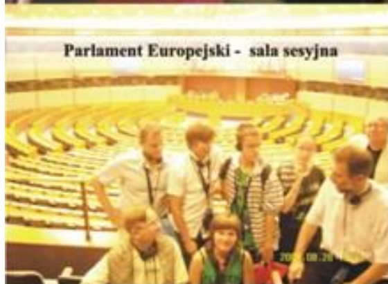
Parlament Europejski - sala sesyjna