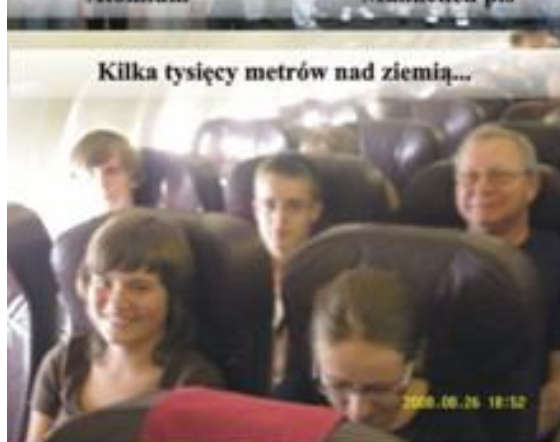
Kilka tysięcy metrów nad ziemią...