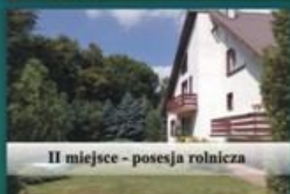
II miejsce - posesja rolnicza