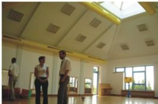
Jedna z sal kleszczowskiego przedszkola.

Obecnie trwają prace, których celem jest powstanie nowoczesnego kompleksu dydaktyczno - sportowego. Znajdą w nim swoje siedziby dwie szkoły, internat, kryta pływalnia, boisko piłkarskie z podgrzewaną murawą i inne obiekty.