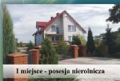
I miejsce - posesja nierolnicza