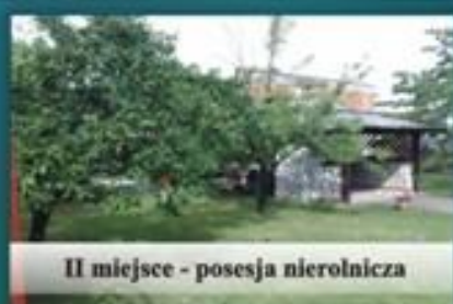
II miejsce - posesja nierolnicza