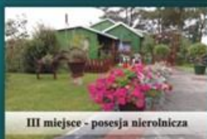
III miejsce - posesja nierolnicza