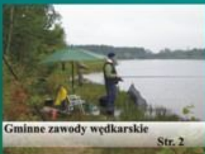
Gminne zawody wędkarskie