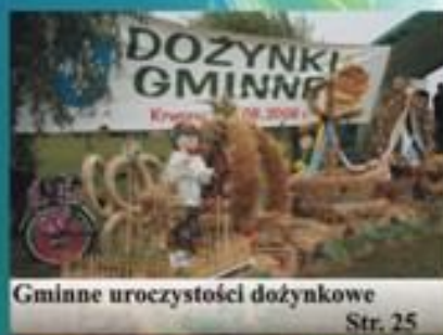
Gminne uroczystości dożynkowe