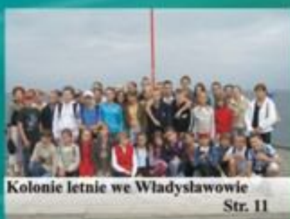
Kolonie letnie we Władysławowie