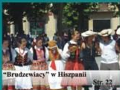
"Brudzewiaci" w Hiszpanii