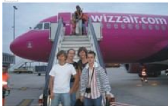
Na lotnisku w Brukseli