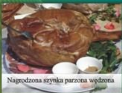
Nagrodzona szynka parzona wędzona