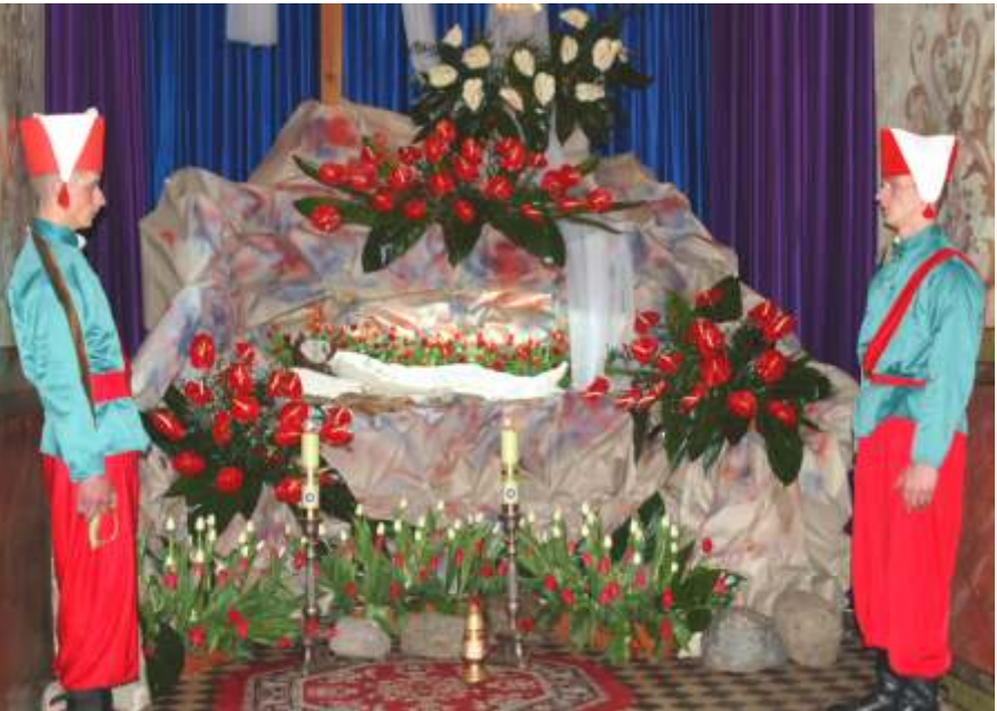
Turki przy Grobie Pa skim w ko cieie parafialnym w Brudzewie