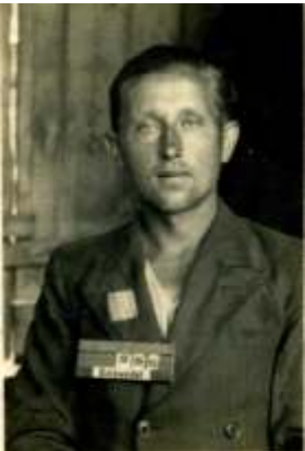
Wacław Muszy ski str. 4