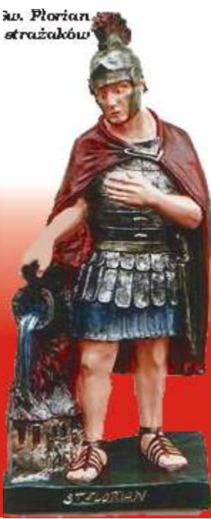
św. Florian patron strażaków