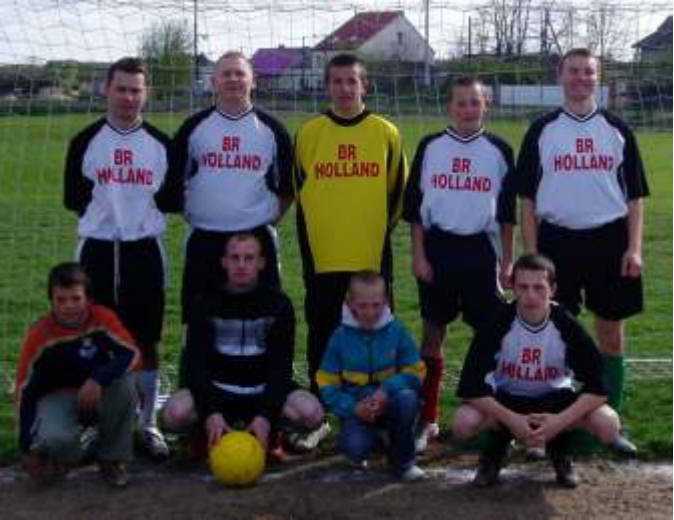
Dru yna z Brudzynia Wyniki pierwszej kolejki rozegranej w dniu 2007-05-01